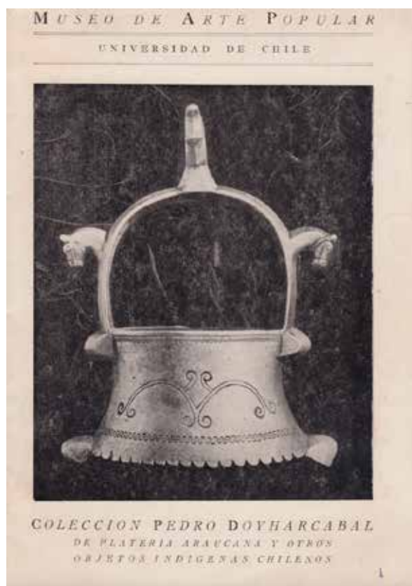
Fig. 2. Portada de catálogo Colección Pedro Doyharcabal de platería araucana y otros objetos indígenas chilenos (1946). Santiago: Museo de Arte Popular. Biblioteca MAPA.

su difusión y posterior adquisición, posicionando una valoración estética que hasta el minuto no habían obtenido objetos similares a nivel institucional, y que, sumada a la inscripción etnográfica, otorgaría a la colección una condición híbrida a nivel de comprensión y circulación. Como veremos, esto obedece a una concepción artística sui generis , si atendemos a las nociones de arte indígena y arte popular que circulaban en el periodo.